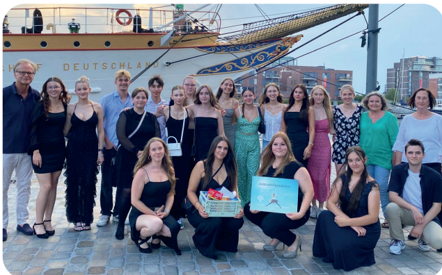
Jugendgruppe der evang. Kirche Schiffdorf/Surheide

Sich ehrenamtlich zu engagieren, während man selbst noch die Schulbank drückt, gerade in der Ausbildung steckt oder das Studium begonnen hat, ist keine Selbstverständlichkeit. Aus diesem Grund und zur Anerkennung des Engagements wurde der Jugendförderpreis in diesem Jahr an die Jugendgruppe der evangelischen Kirche Schiffdorf/Surheide überreicht. Rund 15 Jugendliche engagieren sich jede Woche für die Kinder in ihrem Stadtteil, organisieren Ausflüge, gestalten Ferienprogramme und sind Ansprechpartner für die Kinder. Die Laudatio hielt Imke Siems-Pöhl, die eindrucksvoll und bewegend die Jugendlichen mit ihrem Engagement in den Vordergrund stellte.