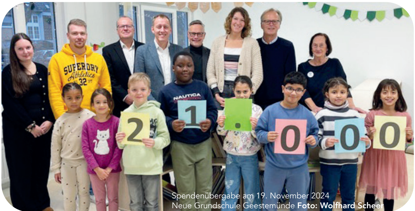
Spendenübergabe am 19. November 2024 Neue Grundschule Geestemünde

für das Projekt Schulfrühstück an Bremerhavener Schulen